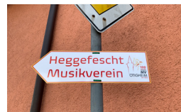
17. -19. MAI HEGGEFESCHT