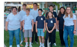
2. - 10. JUNI KONZERTREISE NACH GABICCE MARE