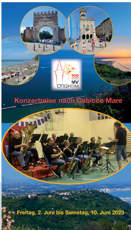
Freitag, 2. Juni bis Samstag, 10. Juni 2023

Alle Teilnehmenden des Musikvereins und der Gemeinde erlebten einen unvergesslichen Aufenthalt an der Adria bei gutem Wetter, bester Gastfreundschaft, viel Unterhaltung und kulturellen Eindrücken. Ausflüge nach San Marino, Fano und Gradara, eine Weinprobe in Pesaro sowie Angebote für die Jugend, wie z.B. eine Bootstour, gehörten zum erlebnisreichen Programm.