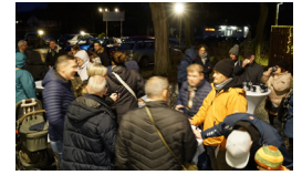
9. DEZEMBER WINTERVERGNÜGEN