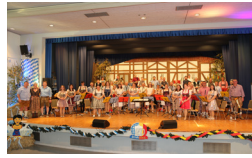
21. OKTOBER OKTOBERFEST