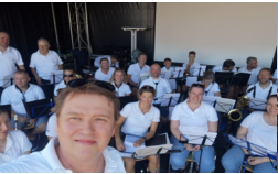
9./10. SEPTEMBER DORFFEST