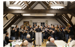
10. NOVEMBER GENERAL- VERSAMMLUNG